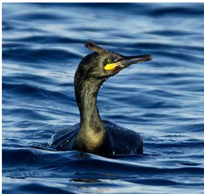
Toppskarv, Phalacrocorax aristotelis , i sin helmörka häckningsdräkt. Endast den gula mungipan bryter av.

Längs västkusten förekommer numera även toppskarven. Den är betydligt mindre än storskarven och har under häckningstid en svart tofs på hjässan. Längre var toppskarven en stor sällsynthet i svenska vatten, men från slutet av 1980-talet har den ökat markant och kan vintertid nu räknas i åtskilliga tusental. Sedan några år häckar den även på ett par platser i Bohuslän. Den häckar även talrikt bl.a. längs norska kusten och på Brittiska öarna.