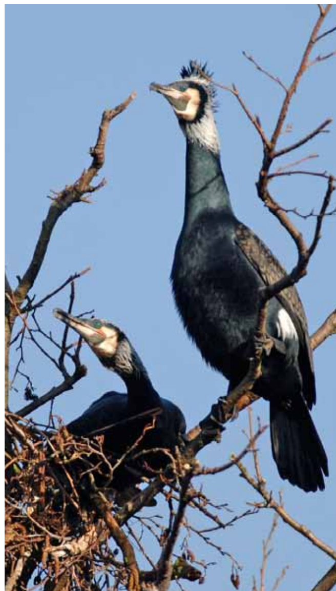
Storskarvar av rasen mellanskarv, Phalacrocorax carbo sinensis , i häckningsdräkt.