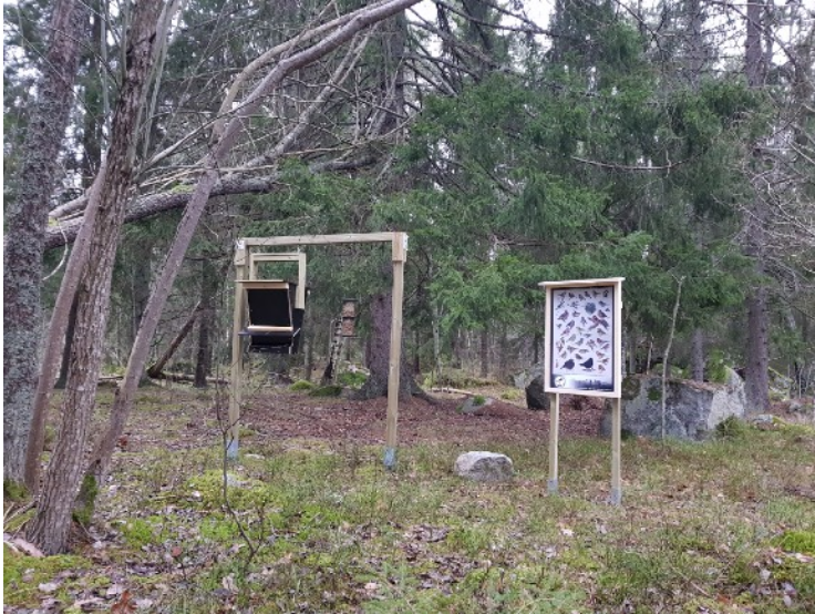
Fågelmatningen i Rimbo